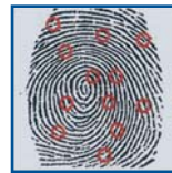
Points caractéristiques repérés par le logiciel appelés "Minuties"