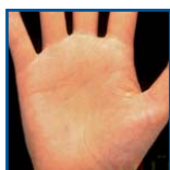
Image de la paume de la main lue par le capteur