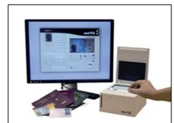
Option : Vérification de la validité de la pièce d'identité

La solution est composée d'un scanner spécialisé avec logiciel d'intégration pour la validation des documents officiels d'identité (carte d'identité, passeport, etc..)