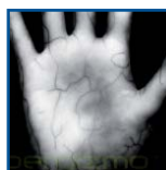
Les capteurs infrarouges prennent une série d'images du réseau veineux