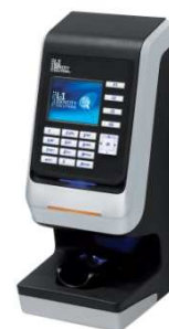
PLATE FORME 4G DE L1-IDENTIFICATION : ZALIX Biométrie, Partenaire Officiel de L1-Identification pour la reconnaissance par le réseau veineux du doigt.

Mot ou clé : Lecteur Biométrique Sécurité et Biométrie Réseau veineux du doigt de la main Avec ou sans badge