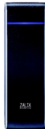
Station encodage des badges ZX-130

Le lecteur ZX-130® sert de station d'encodage badge dans les installations équipées de ZX-150® .